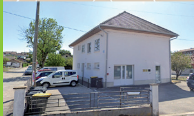
Places de stationnement devant l'entrée