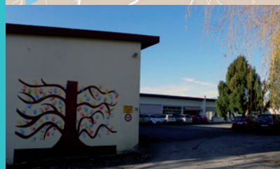
Places de stationnement dans la cour